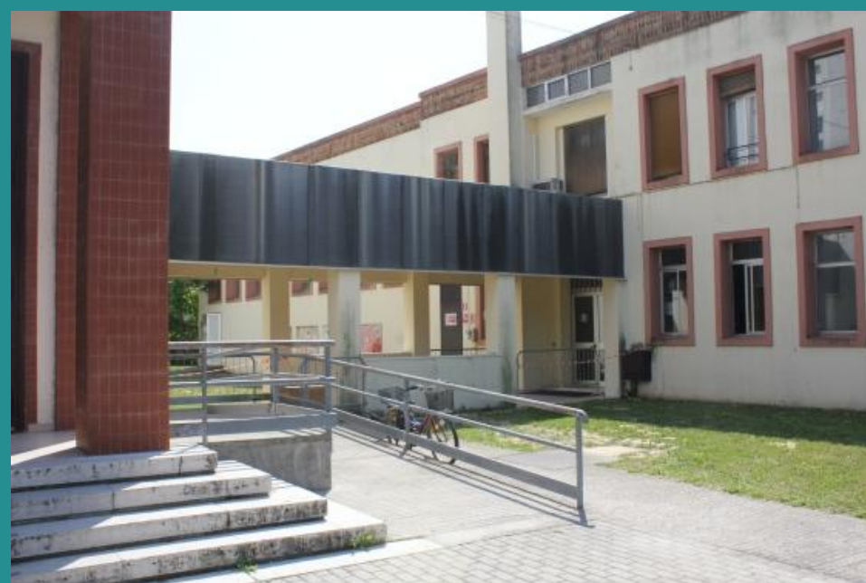
CONTINUITA' SCUOLA PRIMARIA DANTE