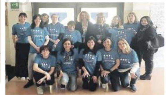
AUTISMO Docenti e studenti della "Dante" con le magliette blu