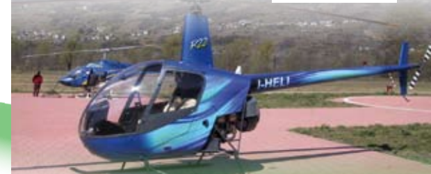
Elicotteri impiegati per i voli degli allievi