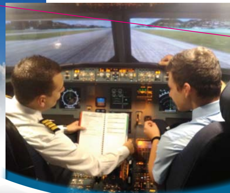
Simulatore di volo Airbus A320 impiegato per i corsi di orientamento Jet

La nostra Scuola propone altresì per gli allievi del quarto e quinto anno un corso unico ed innovativo in Italia di orientamento su velivolo JET di linea plurimotore . Tali corsi, tenuti da un Pilota Professionista, sono svolti grazie alla partnership con FlyVergiate sul simulatore del velivolo commerciale più avanzato del mondo: l' Airbus A320 . Lo stesso simulatore è impiegato da una Scuola di Volo nota a livello internazionale per l'addestramento dei Piloti di Linea.