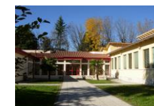
Scuola "S. Pellico"