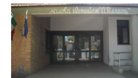
Scuola "A. Manzoni"