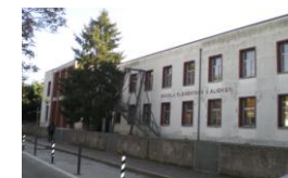
Scuola "Dante Alighieri"